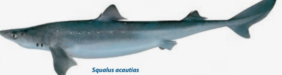
Squalus acutias Opptil 70 cm N Pighhà GB Picked dogfish F Aiguillat cubain D Dornhai E Galludo I Spinarolo P Galhudo PL Koleń RUS Колочая акула JAP アブラツノザメ