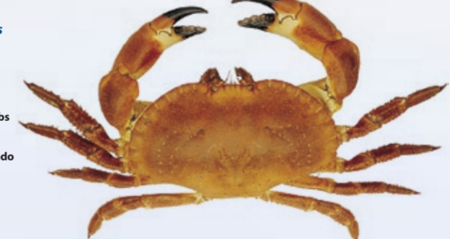
Cancer pagurus Hannen opptil 30 cm Hannen opptil 20 cm N Krabbe GB Crab F Crabe/Tourteau D Kurzschwanz-Krebs E Cangrejo I Granchio P Crustáceo decápodo PL Krab RUS Краб JAP カニ