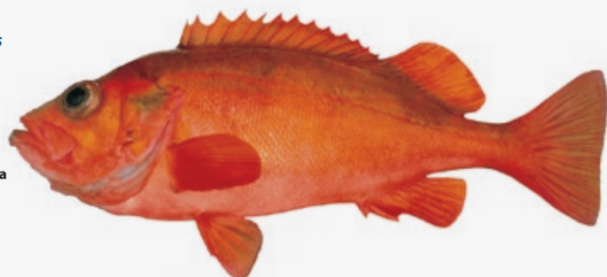
Sebastes marinus Opptil 100 cm N Uer GB Redfish F Sébaste D Rotbarsch E Gallineta nórdica I Scorfano di Norvegia P Cantarillo PL Karmazyn RUS Морской окунь JAP アカウオ