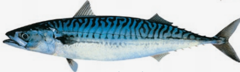
Scomber scombrus Opptil 50 cm N Makrell GB Mackerel F Maquereau D Makrele E Caballa I Maccarello P Sarda PL Makrela RUS Скумбрия JAP サバ