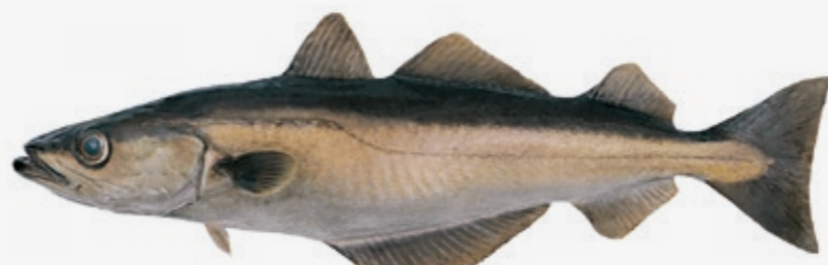
Pollachius pollachius Opptil 130 cm N Lyr GB Pollack F Lieu jaune D Pollack E Abadejo I Merluzzo giallo P Juliana PL Rdzawiec RUS Люп, ноллак JAP ポラック