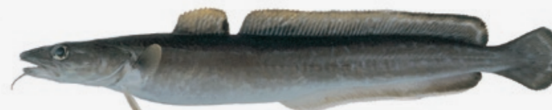
Molva molva Opptil 180 cm N Lange GB Ling F Lingue D Leng E Maruca I Molva Donzela PL Molwa RUS Мольва JAP リング