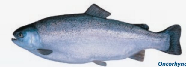
Oncorhynchus mykiss Opptil 70 cm N Ørret GB Trout F Truite d'Europe D Forelle E Trucha I Trota P Truta PL Pstrąg tęczowy RUS Форель JAP ブラウントラウト