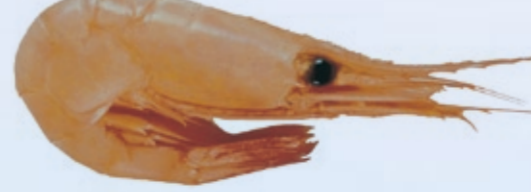
Pandalus borealis 10-12 cm N Reke GB Deepwater prawn F Crevette nordique D Tiefseegarnele E Camaron I Gamberello boreale P Camarão artico PL Krewetka RUS Глубоководная креветка JAP アマエビ