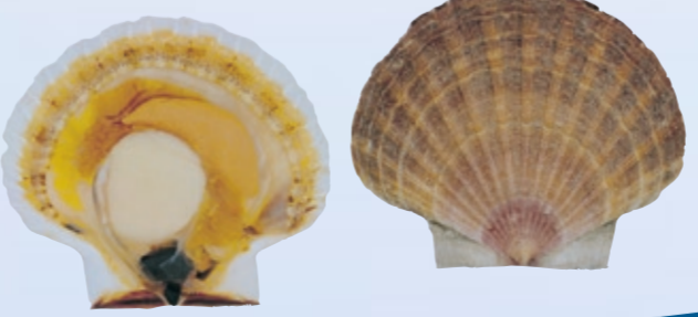
Pecten maximus Opptil 17 cm N Kamskjell GB Scallop F Coquille St.Jacques D Kamm-Muschel E Vieira I Ventaglio-pettine maggiore P Vieira PL Przegrzebki RUS Гребешок JAP ホタテガイ