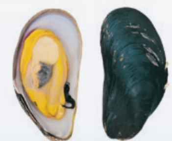
Modiolus modiolus 10-15 cm N O-skjell GB Horse mussel F Moule D Miesmuschel E Mejillón I Mitilo P Mexilhão PL Omulki RUS Двустворчатый моллюск JAP エソヒバリガイ