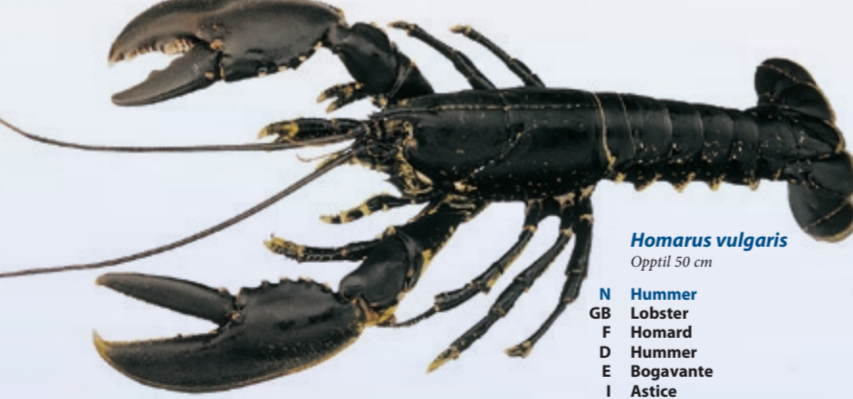
Homarus vulgaris Opptil 50 cm N Hummer GB Lobster F Homard D Hummer E Bogavante I Astice P Lavagante PL Homar RUS Омар JAP ヨーロッパロブスター