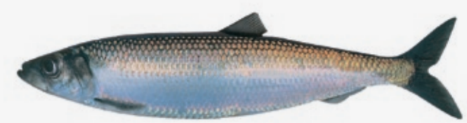
Clupea harengus 25-40 cm N Sild GB Herring F Hareng D Hering E Arenque I Aringa P Arenque PL Sledz RUS Сельдь JAP ニシン