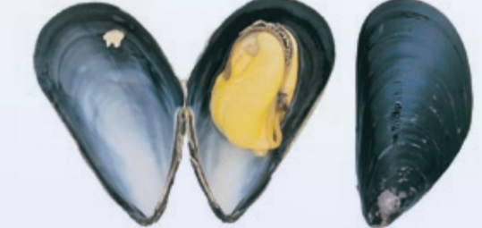
Mytilus edulis 5-8 cm N Blåskjell GB Blue Mussel F Moule D Miesmuschel E Mejillón I Mitilo P Mexilhão-vulgar PL Omulki RUS Мидия JAP ムラサキガイ