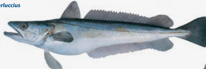
Merluccius merluccius Opptil 135 cm N Lysing GB Hake F Merlu D Seehecht E Merluza I Nasello P Pescada PL Morszczuk RUS Мерлуца JAP ハイク